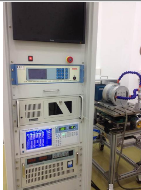
包括WT1800在内的电机测试系统